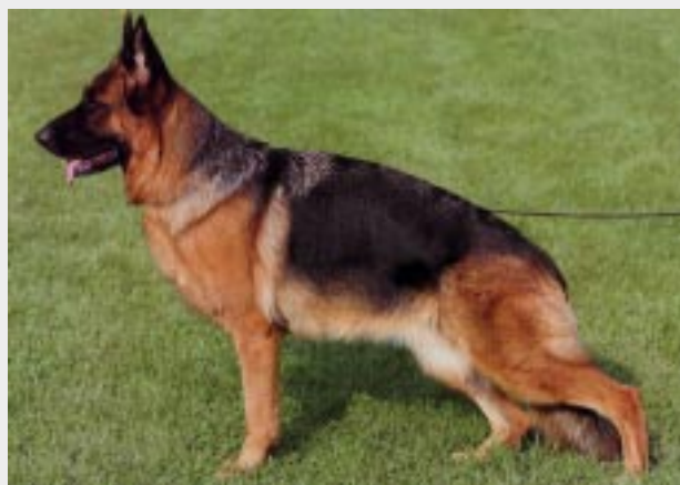
Il maschio, Sieger 2005, e la femmina, Siegerin 2005, entrambi utili, esprimono con vantaggio l'indole del proprio sesso